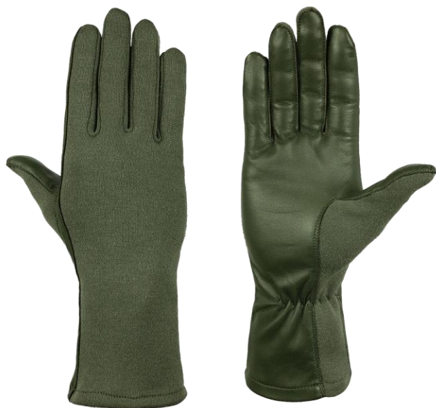
TRACY Long Sage Green

Taktické nehořlavé rukavice určené zejména pro piloty, odstřelovače a speciální týmy vyžadující mimořádnou citlivost pro ovládání palubních přístrojů a pro snadnou manipulaci se zbraní.