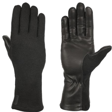
TRACY Long Black